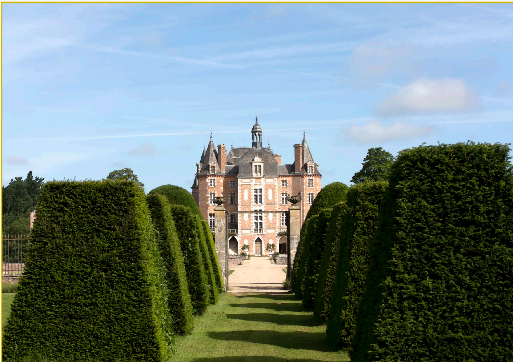
JOHANN JOACHIM QUANTZ ~ CONCERTO FOR FLUTE, STRINGS & BASSO CONTINUO IN G MAJOR No. 161